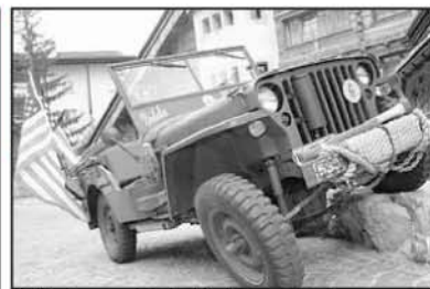
«Gilda», la mascotte du club de Crans-Montana. MAMINVA

bien sûr s'ils utilisent d'autres moyens de locomotion que le parapente et les chaussures. L'organisation et le suivi de la course sont assumés par l'école de parapente Twist'Air basée à Vercorin. Le concept permet de se passer de bénévoles car il n'y a pas de parcours à baliser, chaque participant ayant toute autonomie pour le choix de l'ordre des cabanes, ainsi que pour le choix de son itinéraire. De plus, le fait d'imposer la nuit en cabane solutionne les questions liées au ravitaillement. L'utilisation de balises satellitaires permet d'assurer la sécurité des concurrents et leur suivi minute par minute en direct, accessible au public dès le début de la course sur www.vercofly.ch/livetracking